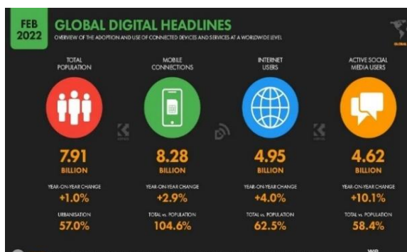
Gambar 1: Data (Tren) Pengguna Internet dan Media Sosial di tahun 2022 yang menggambarkan data dan tren pengguna Internet dan media

Tujuan HootSuite mengeluarkan data tren tersebut adalah untuk memberikan gambaran secara global dan mendukung layanan utama mereka yaitu layanan manajemen content yang menyediakan layanan media daring yang terhubung dengan berbagai situs jejaring sosial seperti Youtube, Whatsapp, Instagram, Facebook, Twitter, Line, Pinterest, Messenger, Wechat (Weixin), QQ, Qzone, Tiktok (Douyin), Sina Weibo, Reddit, Douban, LinkedIn, Baidu Tieba, Skype, Snapchat, Viber, dan lain-lain.