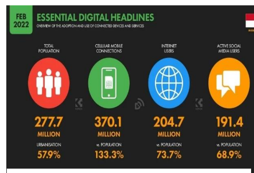
Gambar 2: Data (Tren) Pengguna Internet dan Media Sosial di Indonesia tahun 2022.

Selanjutnya dalam gambar 3 disampaikan data mengenai pengguna internet di Indonesia menghabiskan waktu dalam mengakses media sosial.