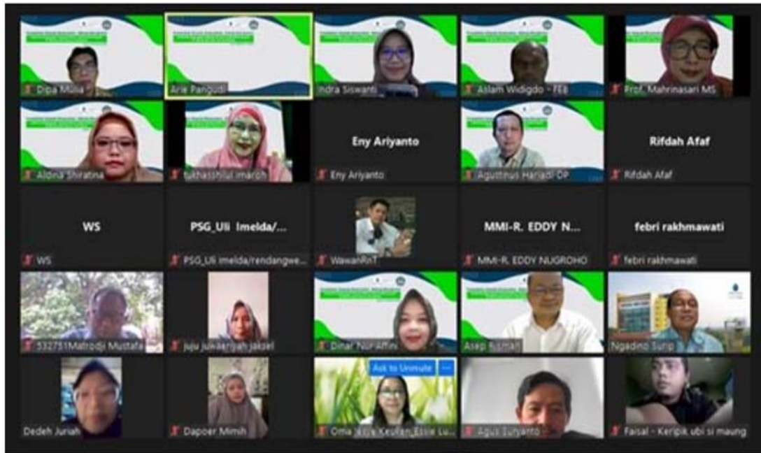
Gambar 4. Kegiatan Pengabdian Kepada Masyarakat secara daring