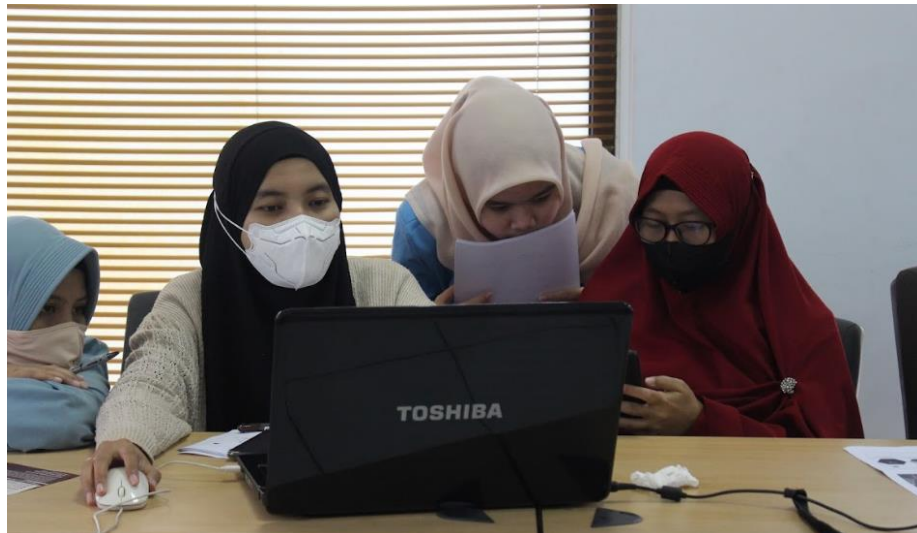
Lampiran 6. Pendampingan Tim PM pada Peserta Pelatihan