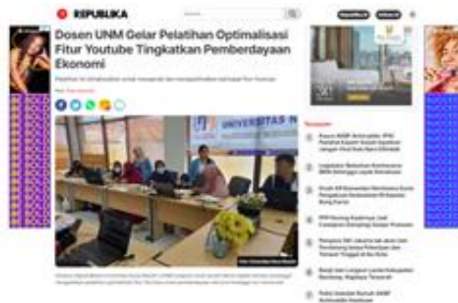
Gambar 1. Luaran Publikasi pada Republika