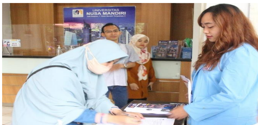
Lampiran 1. Registrasi Peserta