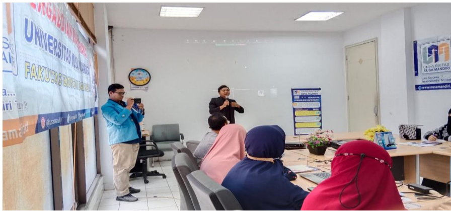
Lampiran 2. Sambutan Kepala Kampus UNM Damai