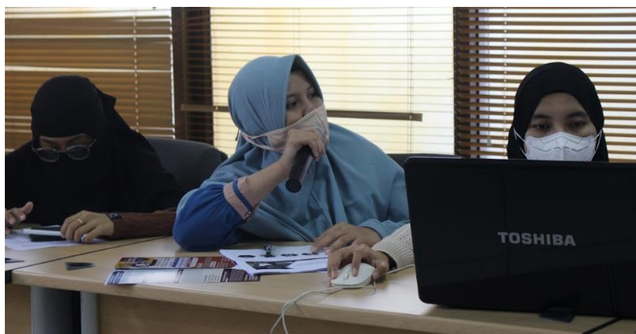
Lampiran 7. Sesi Tanya Jawab