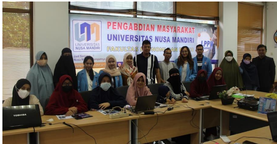
Lampiran 8. Foto Bersama