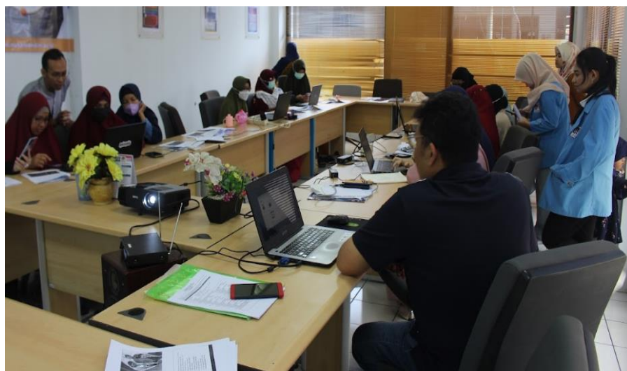
Lampiran 4. Pelaksanaan Pelatihan