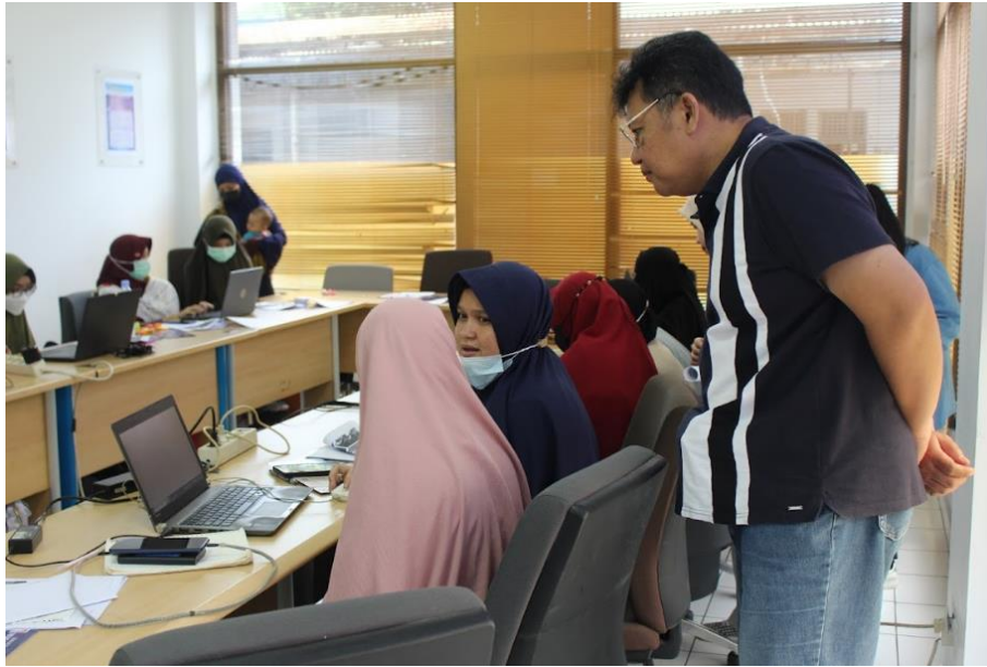
Lampiran 5. Pendampingan Tim PM pada Peserta Pelatihan