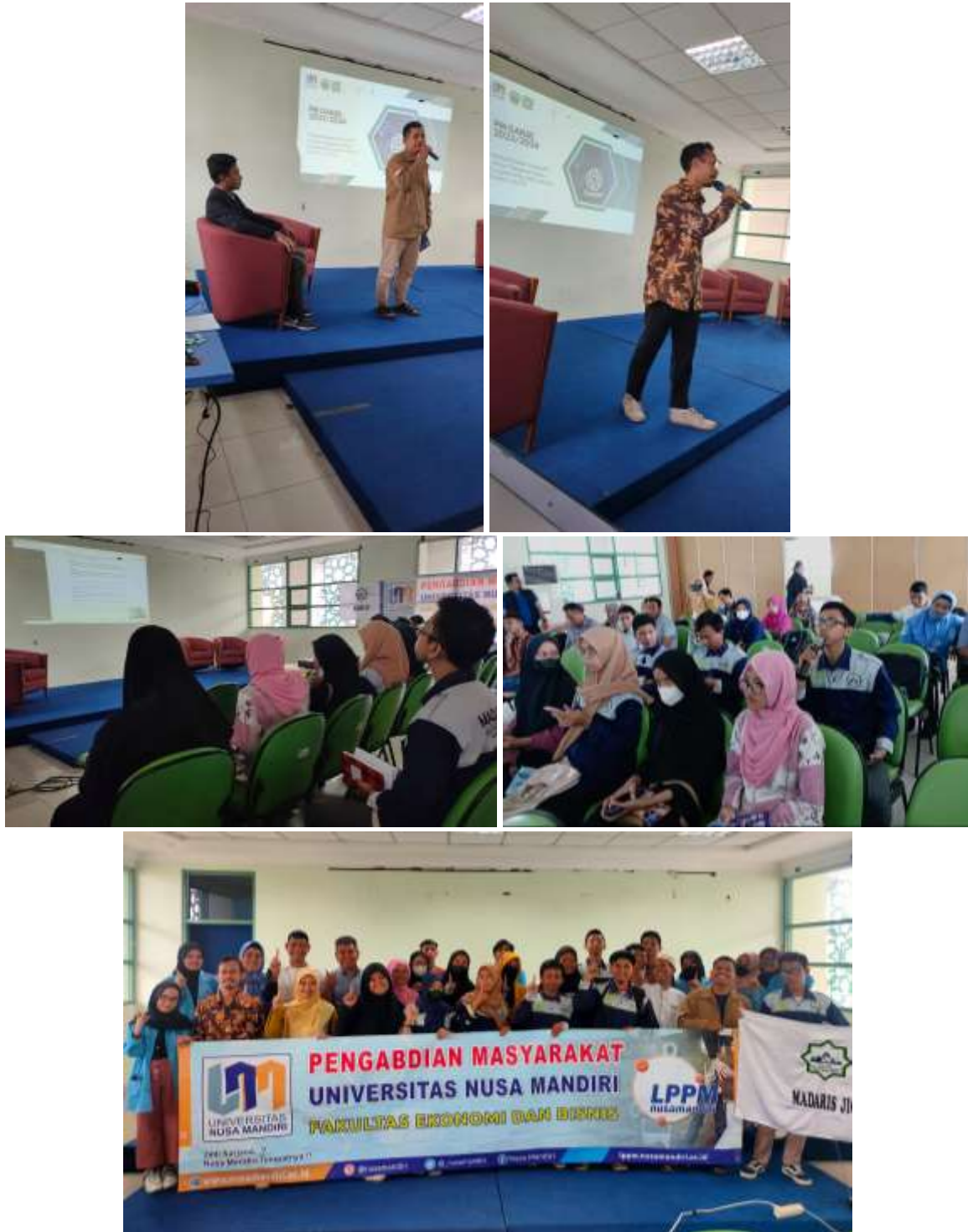
Lampiran 1. Foto Kegiatan Pengabdian