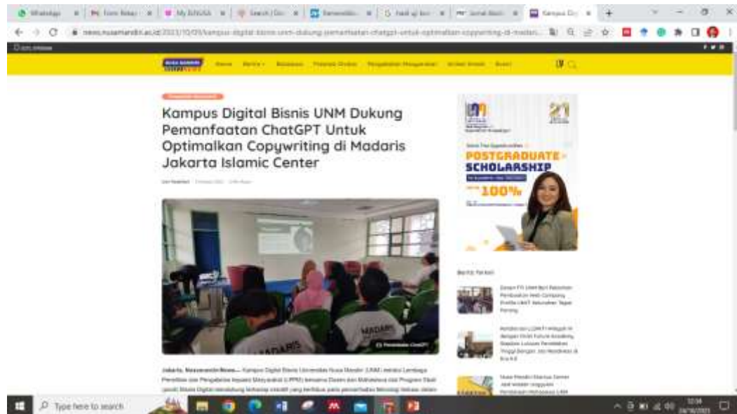
Gambar 2. Luaran Kegiatan Pengabdian Masyarakat

iklan/ copywriting melalui pelatihan yang disampaikan. Selain itu dihasilkan publikasi pada media masa serta luaran utama dapat berbentuk artikel jurnal yang diterbitkan pada penerbit jurnal nasional dengan judul Kampus Digital Bisnis UNM Dukung Pemanfaatan ChatGPT Untuk Optimalkan Copywriting di Madaris Jakarta Islamic Center yang telah terbit pada 17 Oktober 2023 pada link https://news.nusamandiri.ac.id/2023/10/09/kampus-digital-bisnis-unm-dukung-pemanfaatan-chatgpt-untuk-optimalkan-copywriting-di-madaris-jakarta-islamic-center/